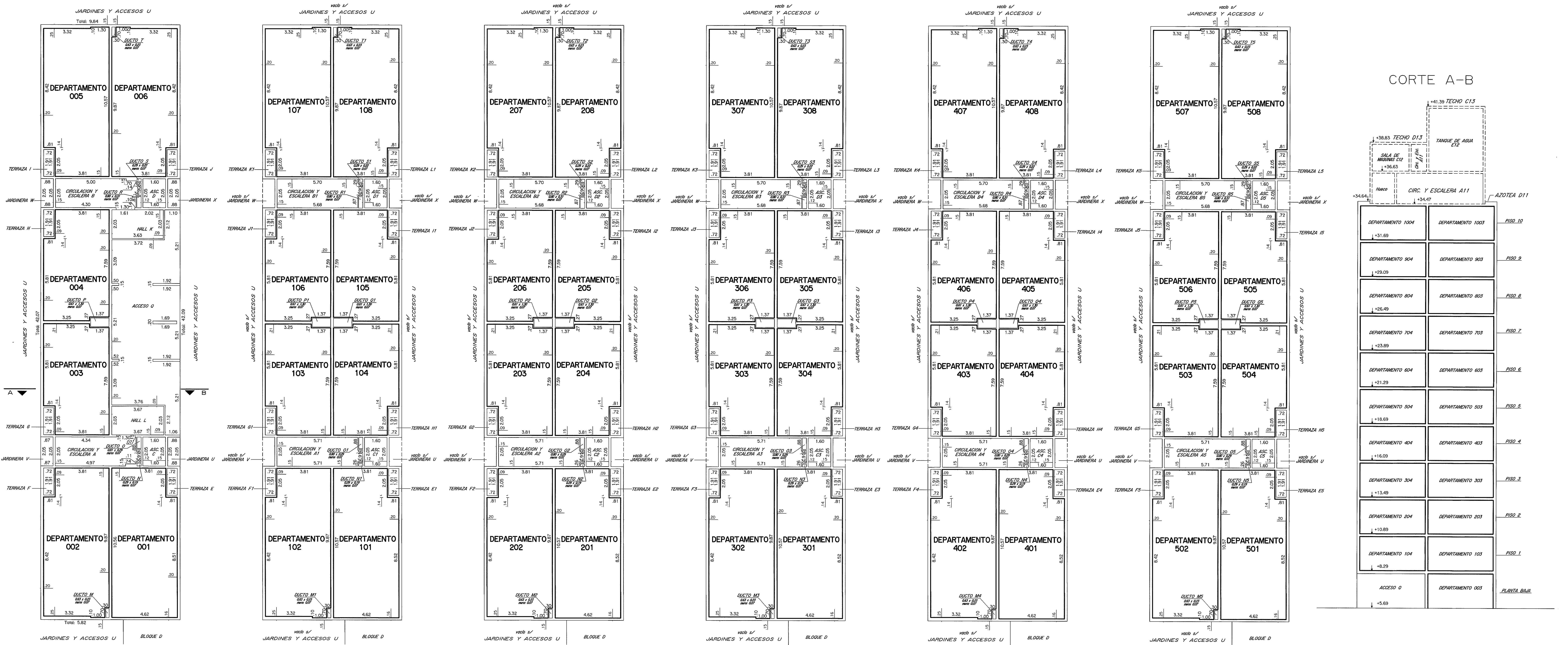
Total Planta Baja 276.64