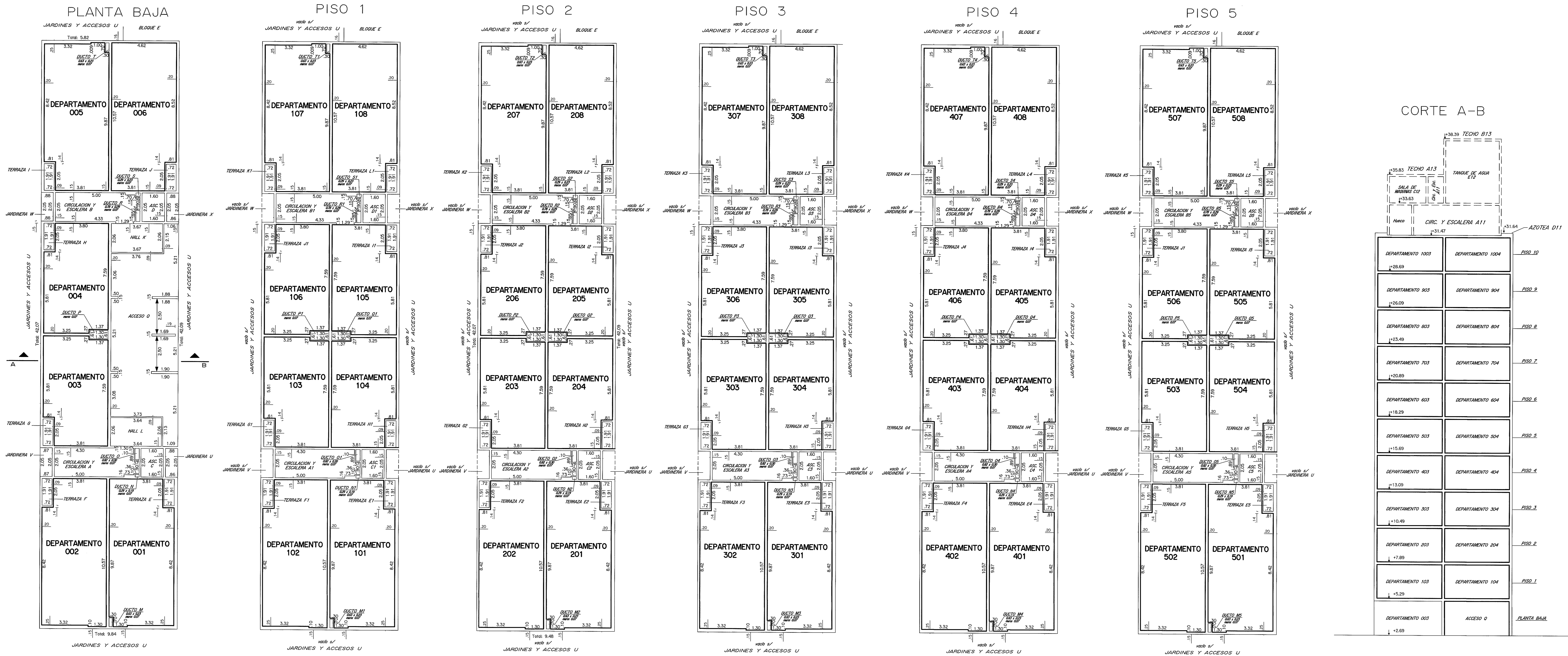
PLANILLA de áreas en metros cuadrados