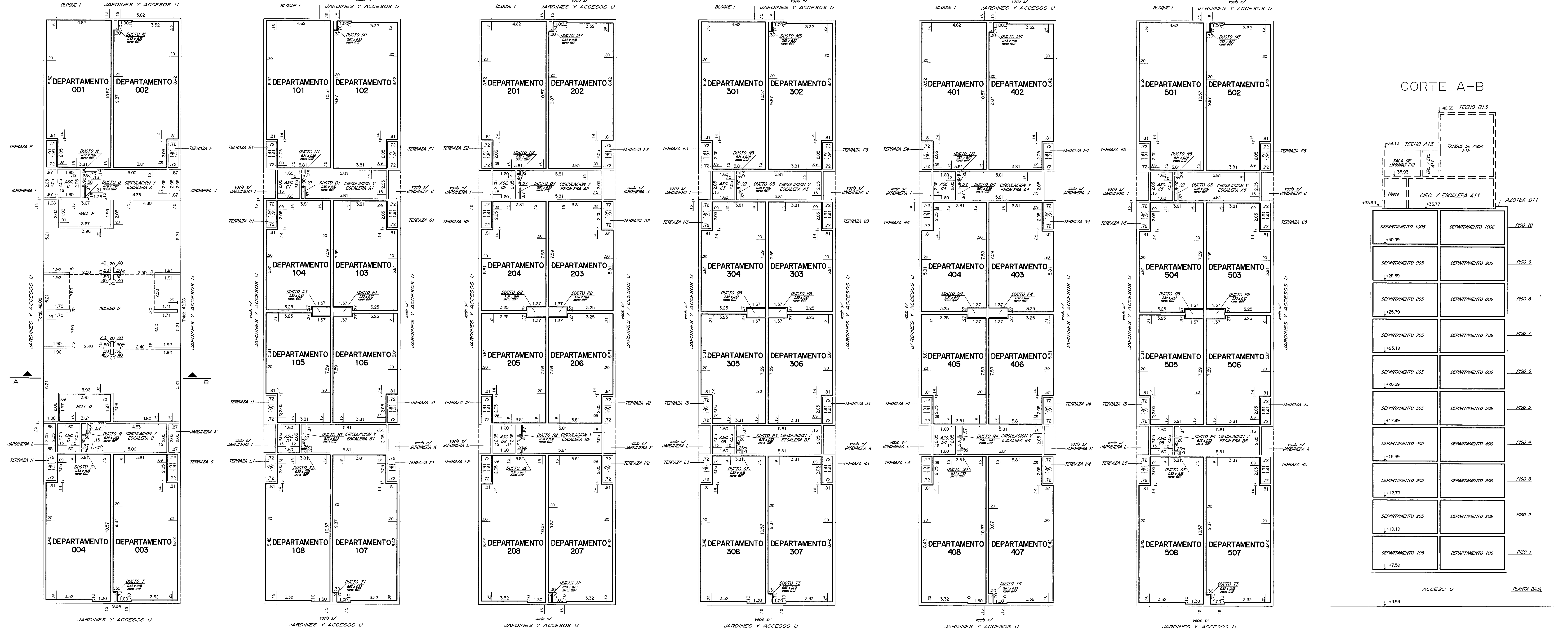
PLANILLA de áreas en metros cuadrados